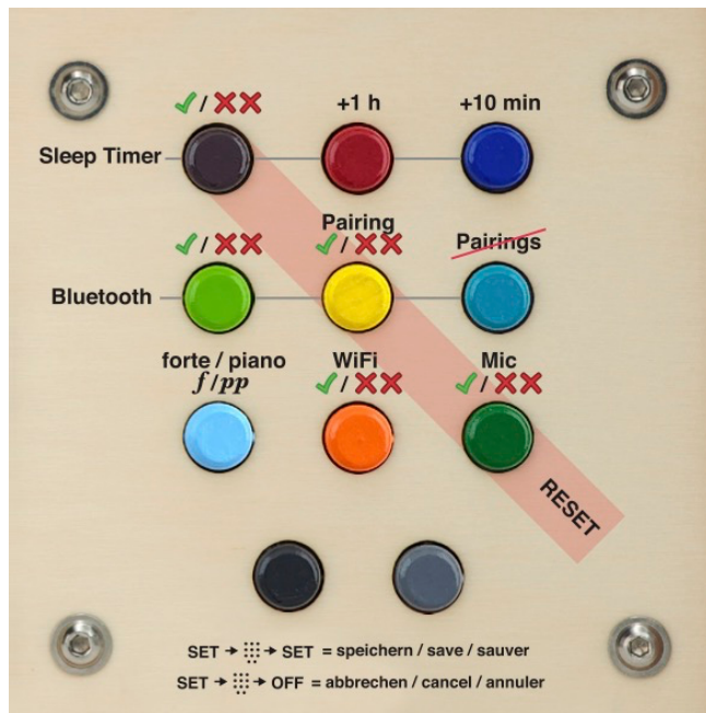
Abbildung 1 - SET-Schablone hörbert